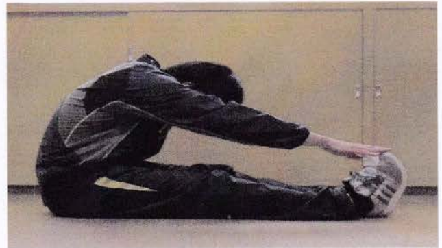
※膝を伸ばして頑張る！