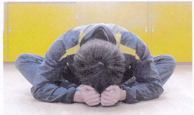
※簡単なら胸、あごにチャレンジ！